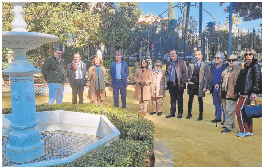
Distintos representantes del Ayuntamiento posan delante de una de las fuentes

La última fuente de este conjunto, la más próxima a Santa Cruz, también reconstruye un plato dentado en los inicios y que fue un adelanto para su tiempo, muy elogiado en ese momento por su belleza. Resulta destacable que la documentación recuperada detallaba que las piezas que se utilizaban inicialmente no eran originales sino recuperadas de otros enclaves sin especificar su origen, de ahí las diferencias entre ellas.