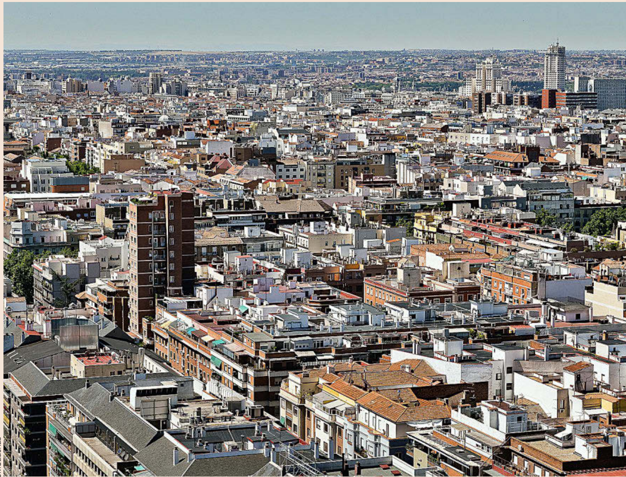
Las valoraciones de los inmuebles han generado una avalancha de reclamaciones por parte de los contribuyentes.

El Supremo estudia un asunto sobre una liquidación del Impuesto sobre Transmi-