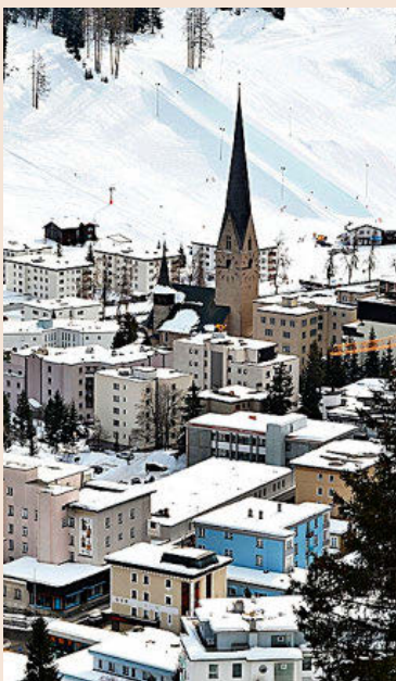
Imagen de Davos (Suiza).

Socio responsable global de Banca y Mercado de Capitales de KPMG