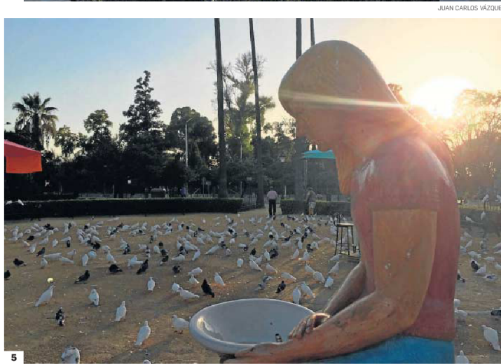
1. Los trabajos de reposición de las últimas victorias aladas que se restauraron de la Plaza de América. 2. Restauración llevada a cabo en el monumento a Bécquer del Parque de María Luisa. 3. La escultura que adorna la glorieta de Luis Montoto del Parque de María Luisa fue intervenida para reponerle la cabeza. 4. Una de las fuentes de los Jardines de Murillo que se han repuesto según los modelos originales. 5. Una de las niñas de las Fuentes de las Palomas de la Plaza de América tras su restauración.

de estas gloriets y esculturas, se han puesto en marcha dos intervenciones importantes en dos de los pabellones de la Exposición Iberoamericana de 1929. Hace unos culminó la recuperación integral de las fachadas y decoración del llamado Pabellón Real, en la Plaza de América. La inversión en este edificio de estilo gótico-isabelino proyectado por Anibal González ascendió a 1,2 millones de euros. Actualmente, está en marcha el proyecto para adecuar su interior a un espacio museístico dedicado a Anibal González y el Regionalismo, pero todavía no ha pasado el filtro de la Comisión de Patrimonio.